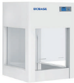
BBS-V500 & BYKG-VII