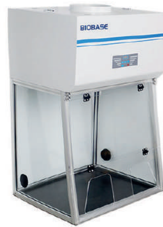
BBS-V700 & BYKG-IX BYKG-X & BYKG-XII