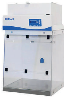
BBS-V600 & BYKG-VIII